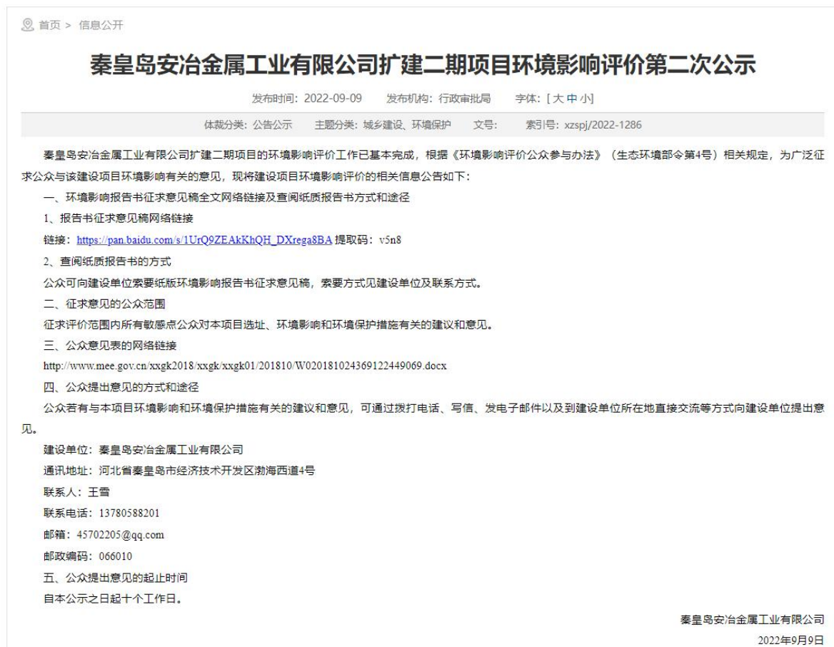
图 2 第二次网络公示截图