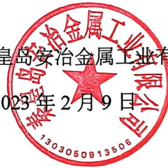
图 6 诚信承诺书