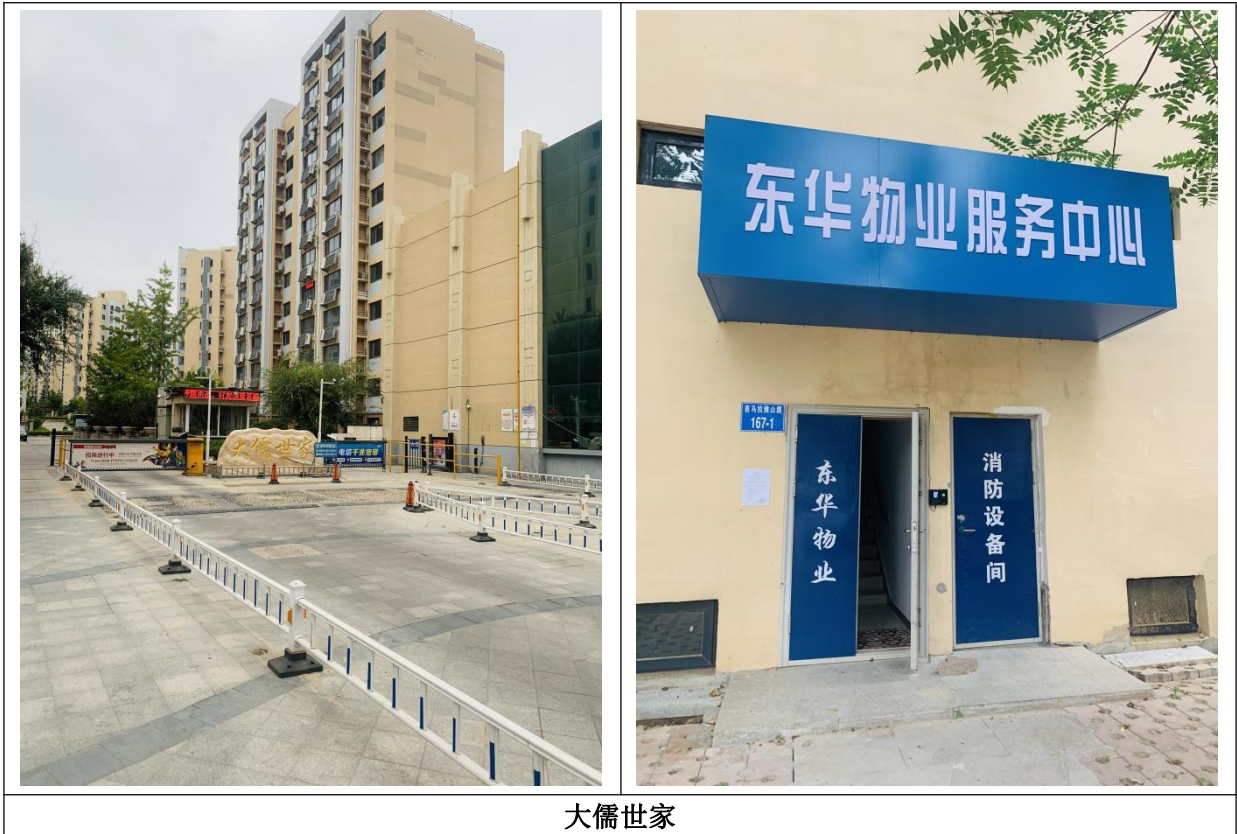
大儒世家 图 5 现场张贴照片