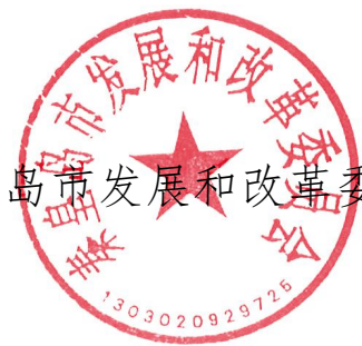
秦皇岛市发展和改革委员会